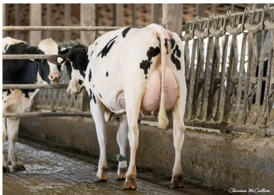
BLOEMEN CRACKER 4559