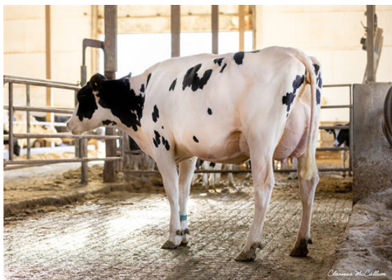
BLOEMEN CRACKER 4559